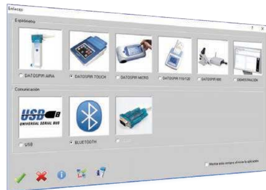
Compatible con todos los espirómetros Sibelmed